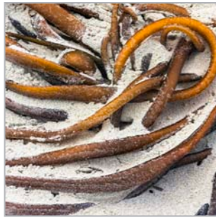
Maui reist in einer göttlich beschützten Wiege aus Seetang (Otago, Südinsel)