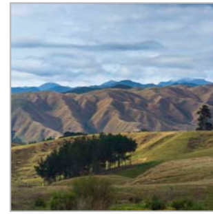
Turangawaewae - Die Heimat als Fundament (Manawatu, Nordinsel)