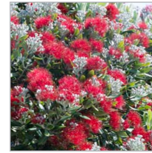
Pohutukawa, ein königlicher Baum (Waiheke Island, Nordinsel)