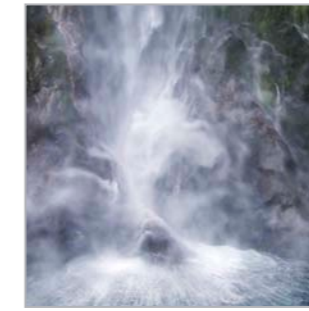
Wasser ist Leben (Milford Sound, Südinsel)