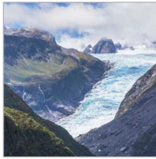
Die Eisprinzessin und ihr Geliebter (Fox Glacier, Südinsel)