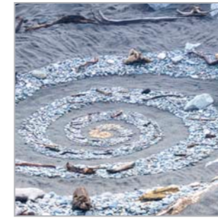
Leben ist Kontinuität und Wandel (Hokitika, Südinsel)