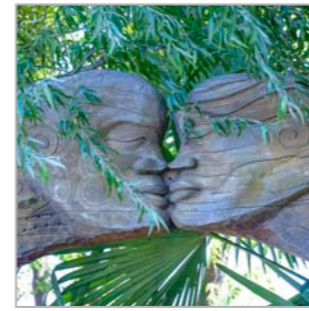
Tane - Der Wald als Lebensspender (Marahau, Südinsel)