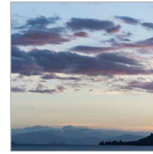
Wir sind Wasserleser, Wolkenleser, Windleser, Sternleser (Lake Taupo, Nordinsel)

Dieser Kalender ist erneut ein besonderes Projekt: Letztes Jahr dienten Zitate amerikanischer Indianervölker als Inspiration, dieses Jahr sind es Mythen und Geschichten der neuseeländischen Maori, begleitet von Fotografien, die 2015 während einer 2-monatigen Reise in Neuseeland entstanden sind. Für die Maori ist ihre gesamte natürliche Umgebung von Bedeutung, ihre Herkunft definieren sie über den Fluss und den Berg, bei dem sie aufgewachsen ist und die Vorfahren, die dort schon lange lebten. Alle Tiere und Pflanzen haben einen Platz in der Schöpfungsgeschichte und sind mit den Menschen verwandt. Viele natürliche Phänomene wie Gletscher, besondere Felsformationen oder Bäume stehen in Verbindung mit Geschichten über ihre Entstehung oder Ereignissen, die sich in mythischer Zeit dort zugetragen haben. Dadurch entsteht eine enge Beziehung zwischen den Menschen und dem Land, in dem sie leben und für dessen Pflege und Erhaltung sie sich verantwortlich fühlen. Dieses Konzept des Kaitiakitanga (Bewahrung des Landes) ist mittlerweile auch in den Gesetzen Neuseelands verankert.