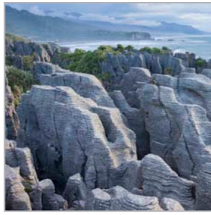
Von der Verwandtschaft zwischen Fels und Wasser (Punakaiki, Südinsel)