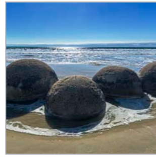
Symbol des Schiffbruchs polynesischer Entdecker (Moeraki, Südinsel)